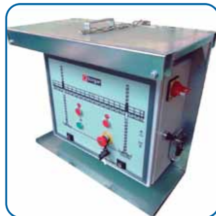
Cuadro de control Control panel

Tramo triangular (Δ600 x 600 mm.) Peso (75 Kg.) Triangular mast section (Δ600 x 600 mm.) Weight (75 Kg.)