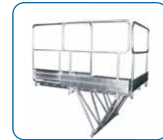
Barandillas laterales telescópicas Telescopic side handrails