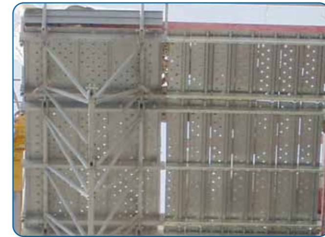
Extensibles con suelo de chapa de acero galvanizado Extensions with galvanized floor plates