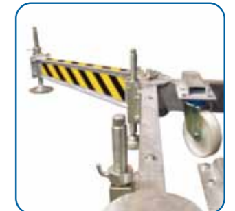
Detalle de la base Base-frame detail

Tramos triangulares compatibles con los montacargas de cremallera T3-10/15 y con la plataforma de transporte PL-40. Tramos cuadrados compatibles con elevador T-1 hasta 2.000 Kg. Para mayores longitudes de plataforma o de extensibles, consultar con nuestro Departamento Técnico. Triangular Mast sections compatible with rack and pinion materials hoist T3-10/15 and with transport platform PL-40. Square Mast sections compatible with our passenger hoist T-1 up to 2.000 Kg. Ask our Technical Department for special specifications like bigger platform length or longer extensions